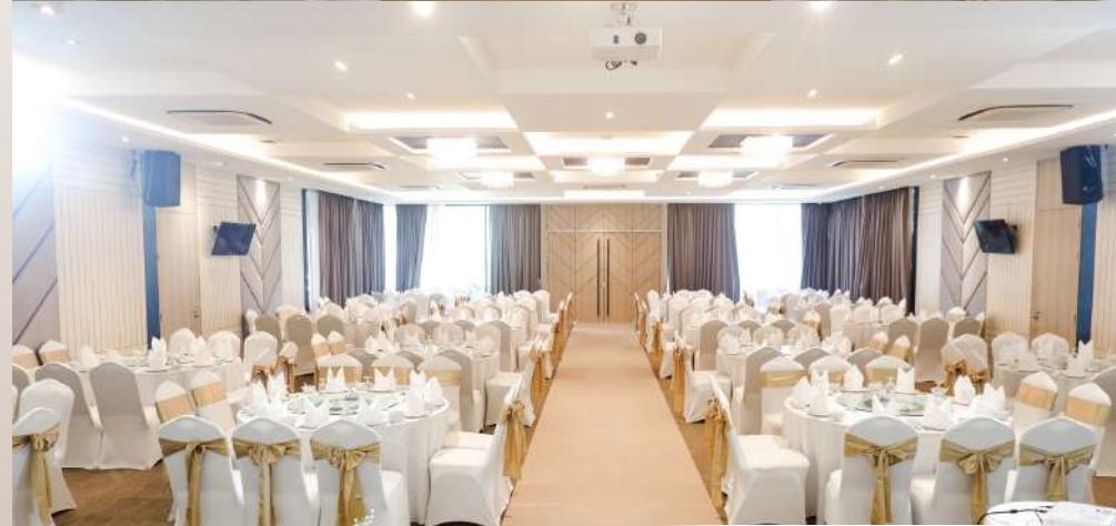
รูปแบบการจัดโต๊ะ BANQUET