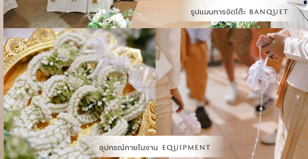
อุปกรณ์ภายในงาน EQUIPMENT